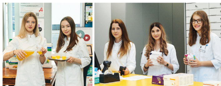
Unsere Lehrlinge freuen sich über einen sicheren Arbeitsplatz mit bester Ausbildung