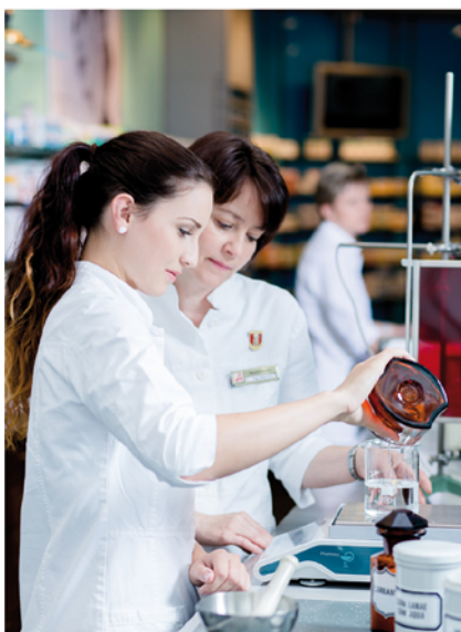
Assistenz bei individuellen Anfertigungen

Unsere Apotheke legt viel Wert auf die Ausbildung von Lehrlingen, um eine positive wirtschaftliche Entwicklung in unserem Bezirk mit gut ausgebildeten Fachkräften zu sichern.